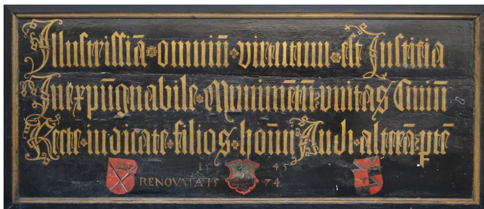
Fatábla Nagyszeben városi tanácsának valamikori üléstermében, jelenleg a nagyszebeni Altemberger Ház Történelmi Múzeumban, Lelt. sz. M. 5964: Illustrissima omnium virtutum est Iustitia/ Inexpugnabile munimentum unitas Civium/ Recte iudicate filios hominum. Audi alteram partem.

Olyan humanisták hatására, mint például a nagyszebeni Georg Reicherstorffer, 26 az erdélyi szászok közigazgatási és politikai elitje lépéseket kezdeményezett az irányban, hogy minél inkább a közjó szolgálatában álló kormányzatként lépjenek fel. A szakirodalom értelmében ez a lépés szükséges volt ahhoz, hogy megerősítsék a városi tanácsok autonómiáját, és ahhoz, hogy törvényes hatóságokká fejlődhessenek. 27 Reicherstorffer 1522-ben kezdte el írni Nagyszeben város első városkönyvét (Stadtbuch) annak érdekében, hogy „a városi tanács minden meghozott döntése ... le legyen jegyezve a jó emlékezetért és az igazságszolgáltatás kötelességének teljesítéséért”. 28 Ehhez hasonlóan a nagyszebeni városházán függő, eredetileg 1545-ben készült és 1574-ben újrifestett fatábla az igazságosságot dicsérte mint a legkiválóbb erényt, és a polgárok egységében rejlő erőt hirdette. A fatáblán látható Nagyszeben, valamint Peter Haller címere a bal és a jobb oldalon, valamint Nagyszeben 1565 és 1576 közötti polgármesterének, Simon Milesnek a címere is. 29